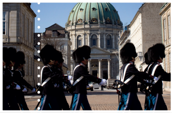
Unaf Hjørrn - Copenhagenmedicenter.com